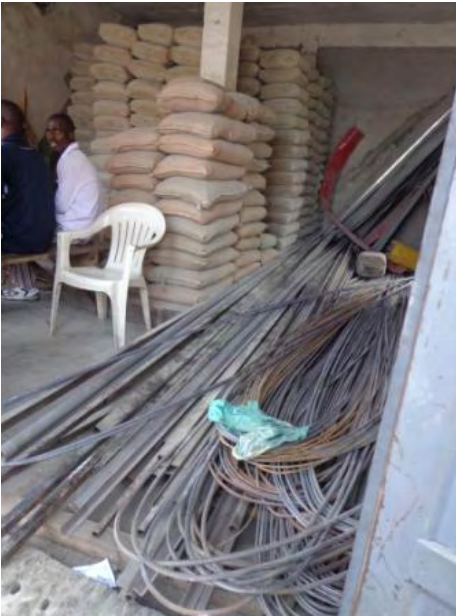
Zement und Eisenstangen