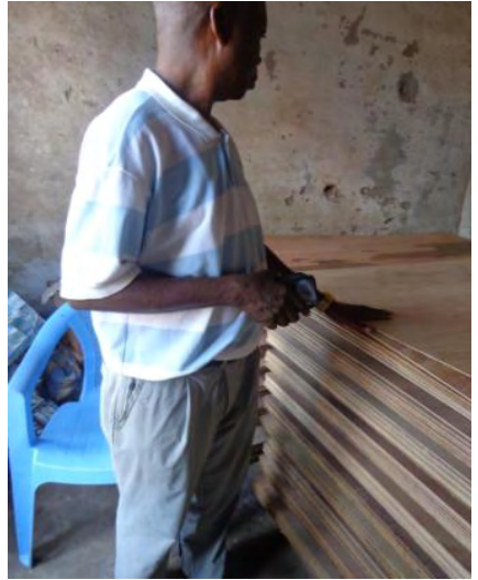
Holzplatten für die Decke